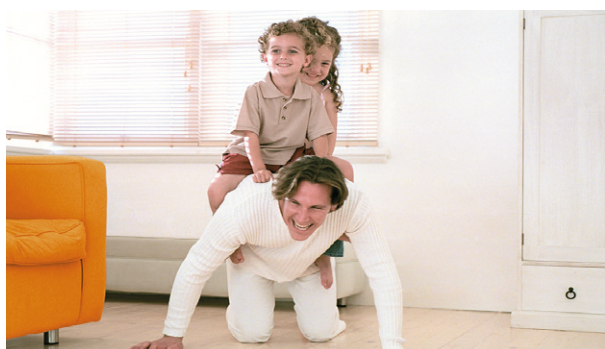
Защищает микроклимат в помещении естественным образом: Известковая штукатурка KIP и известковая шпаклевка KGN.

Экологический баланс известковых составов для внутренних работ полностью положительный. Они изготавливаются из высококачественного минерального сырья и состоят из природных добавок, таких как известняк, песок, мрамор и кварц. В качестве долговечного минерального вяжущего используется известь.