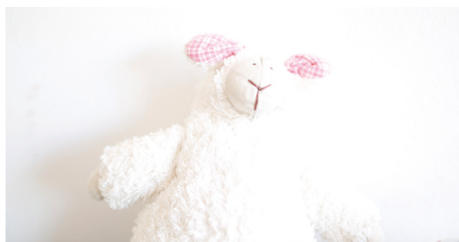
Чистая вещь: KIP и KGN регулируют влажность воздуха в помещении и препятствуют возникновению плесневых грибков.